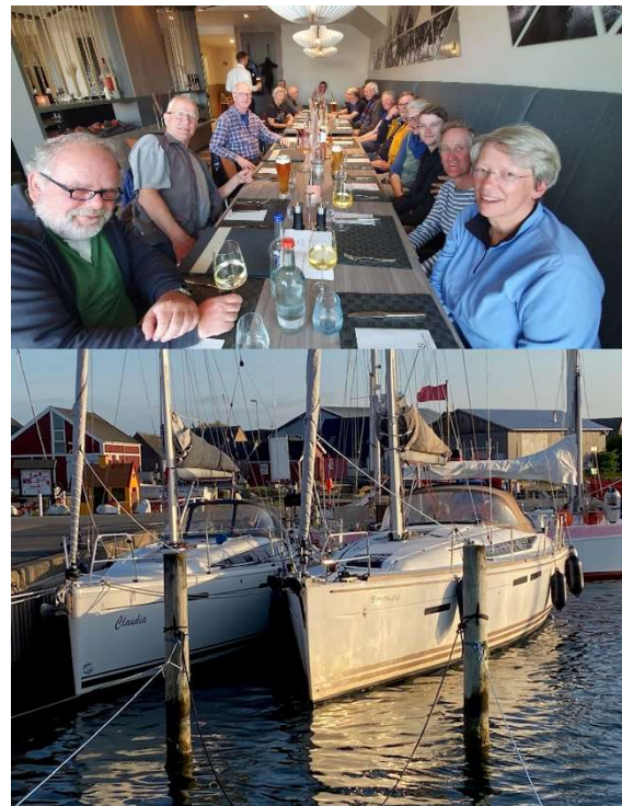
Abschluss Pfingstregatta 2023