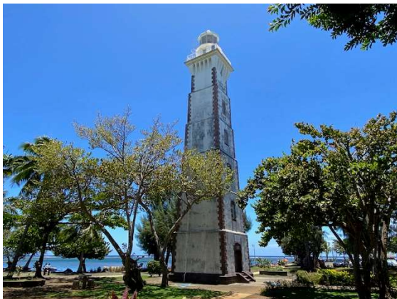
Point Venus, Tahiti