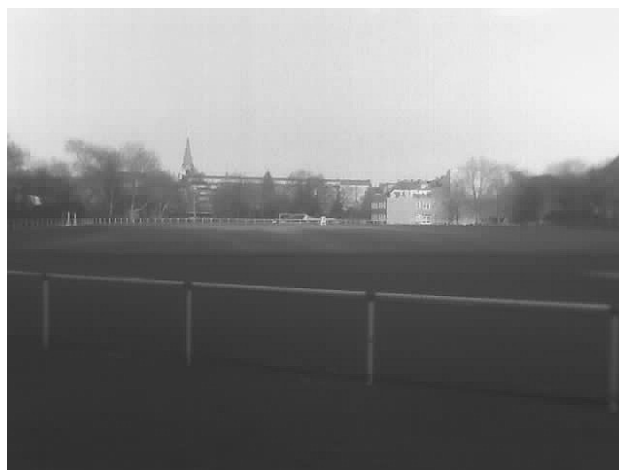
Unsere Mitgliederversammlung fand, wie auch schon in den Vorjahren, wieder im „Sprotcasino“ statt. Wegen des etwas späteren Termins im Jahr, war es, im Gegensatz zu den Vorjahren, noch hell!