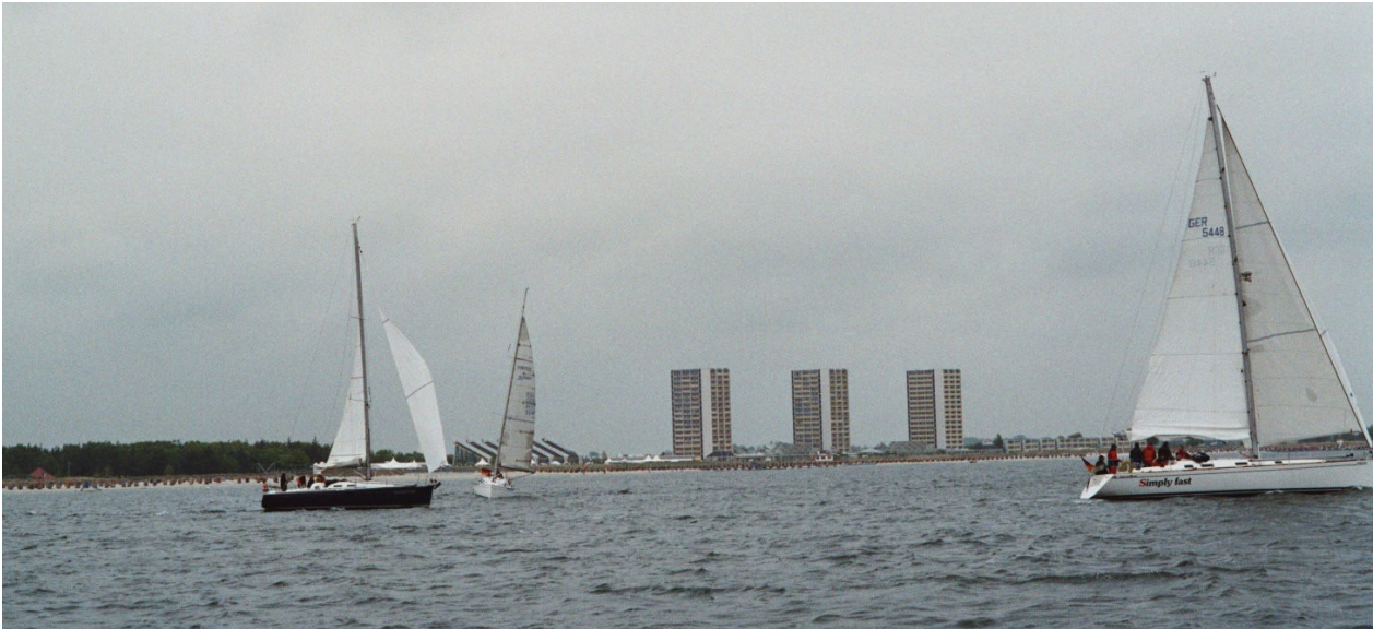
Pfingsten 2006: Auf Dreieckskurs ...