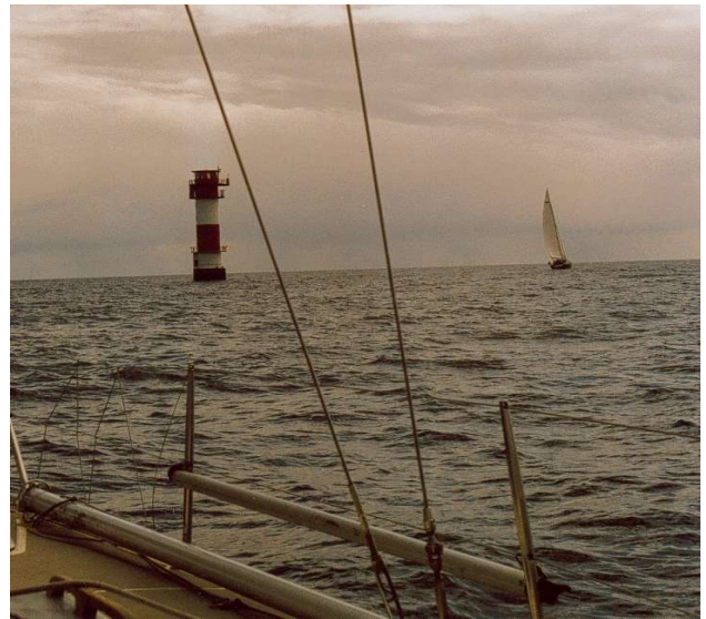
Hier ging's „rechts herum“ und Richtung Wendtorf ...