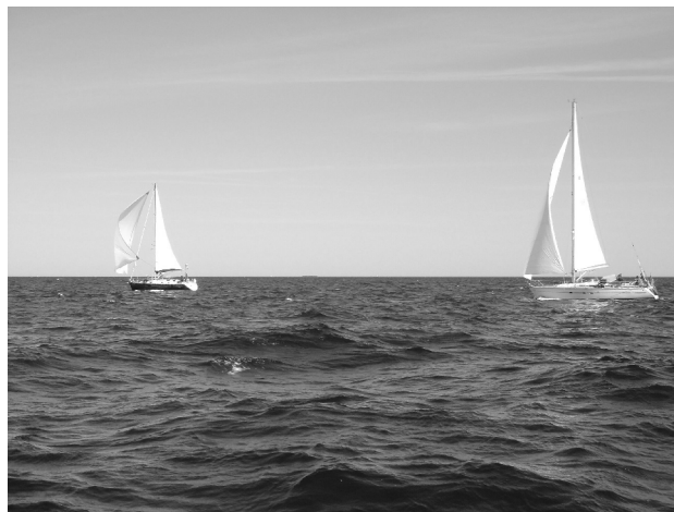
Die VdHSSB unter vollen Segeln